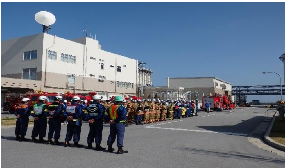
【中部地区消防総合訓練の様子】